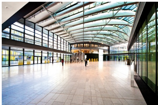
ADAC, München, Deutschland

In großen und hohen Empfangshallen sind Luftdurchlässe gefragt, die Luft weit in den Raum hineinragen können. Intelligente Regelsysteme sorgen zudem für eine schnelle Anpassung an variierende Nutzungsintensität und klimatische Bedingungen.