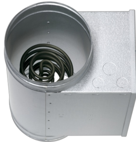
WÄRMEÜBERTRAGER MIT GLATTEN EDELSTAHLHEIZELEMENTEN