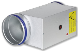
WÄRMEÜBERTRAGER SERIE EL