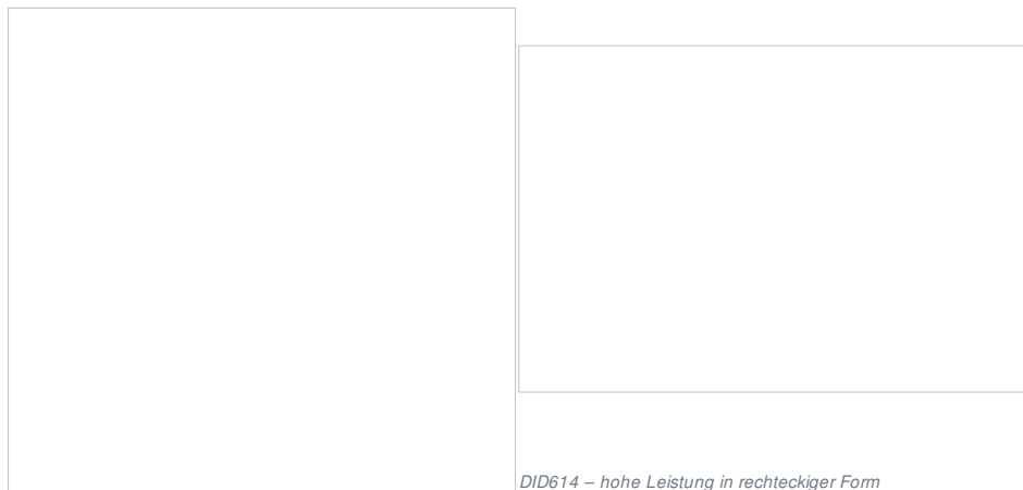
DID614 – hohe Leistung in rechteckiger Form

DID614 – hohe Leistung in quadratischer Form