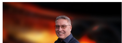
RAINER WILL Rauchfreie Nutzungseinheiten