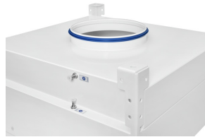
Runder Anschlussstutzen mit Lippendichtung