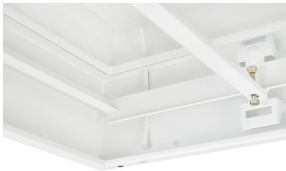
Messrohr innen zur Probenahme für Partikelmessung