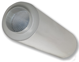
ROHRSCHALLDÄMPFER SERIE CAK