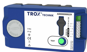
XB0 FÜR TVE UND TVE-Q