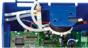
EASYPAB REGLER MIT INTEGRIERTEM EM- AUTOZERO