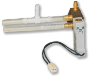
ERWEITERUNGSMODUL TYP EM-AUTOZERO