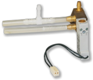
ERWEITERUNGSMODUL TYP EM-AUTOZERO