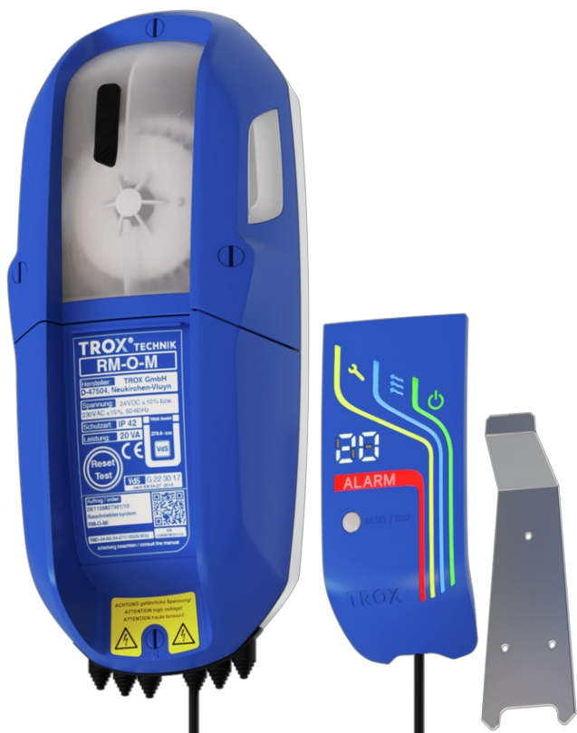
Mit Haltewinkel (rechts)