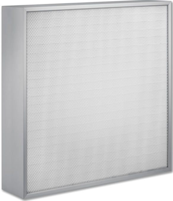
FHD – Ausführung ohne Mittelsteg