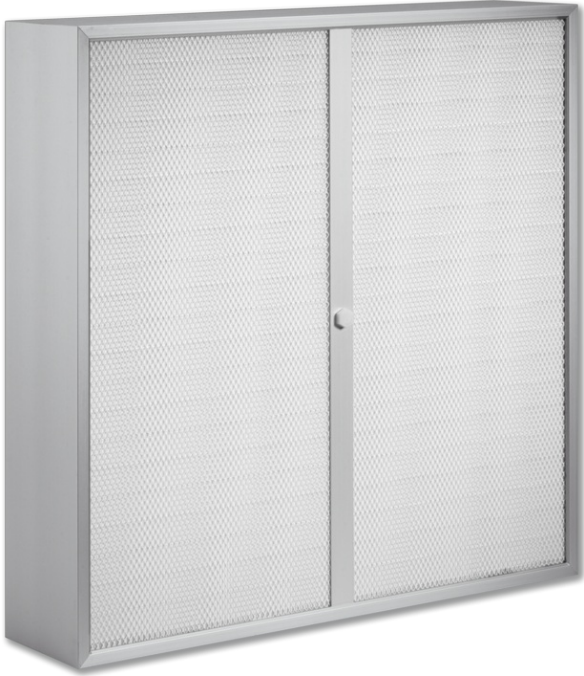
FHD – Ausführung mit Mittelsteg