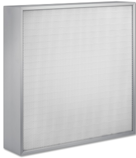
FHD – AUSFÜHRUNG OHNE MITTELSTEG