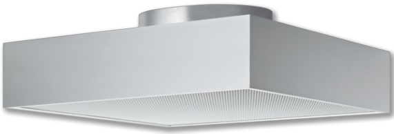
FHD – Ausführung mit Mittelsteg