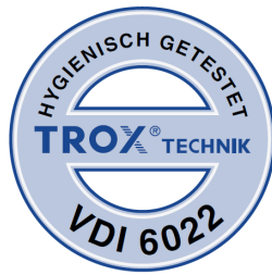
Geprüft nach VDI 6022