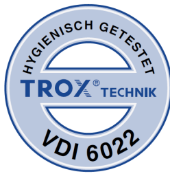
Geprüft nach VDI 6022