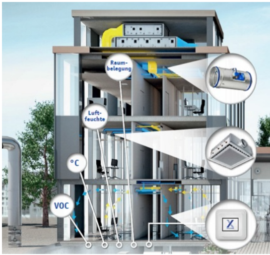
Abbildung 1: Schematische Darstellung einer Einzelraumregelung