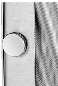
RÄNDELSCHRAUBE ZUR WERKZEUGLOSEN BEFESTIGUNG