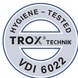
GEPRÜFT NACH VDI 6022