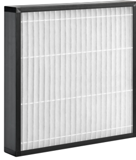
Z-Line-Filter, Ausführung PLA