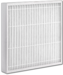
Z-Line Filter, Ausführung NWO