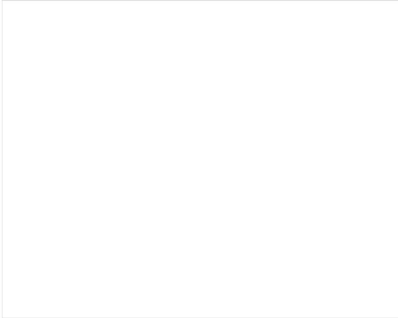
Abb. 1: Grafische Darstellung aller aufgenommenen Messdaten