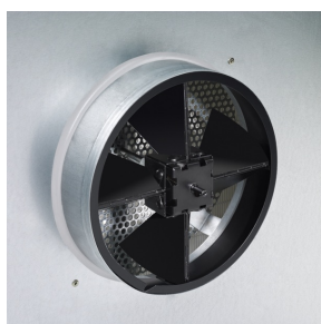
Stutzen mit Drosselement