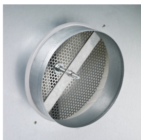
Stutzen mit verstellbarem Prallblech