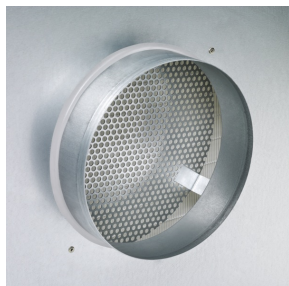
Stutzen mit feststehendem Prallblech