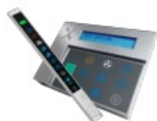
Beleuchtungsschaltung über Bedieneinheit