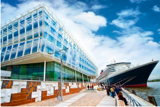
Unilever, Hamburg, Deutschland

Für zentrale und dezentrale Luft-Wasser-Systeme sprechen folgende Vorteile: