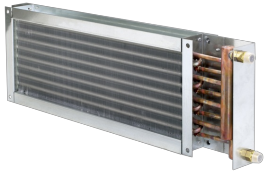
HEAT EXCHANGERS TYPE WT