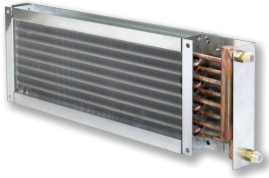
HEAT EXCHANGERS TYPE WT