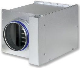
HEAT EXCHANGER TYPE WL