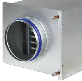
HEAT EXCHANGER WITH COPPER TUBES AND ALUMINIUM FINNS