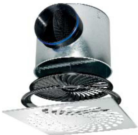
XARTO Dralldurchlass mit optimiertem Drallflügel

Besonders die XARTO Dralldurchlässe unterstreichen dabei das Messemotto. Sie sind das Beispiel für die gelungene Entkoppelung von Funktion und Design. Der Frontdurchlass in vielen Designvarianten bietet Architekten eine große Auswahl an raffinierten Designs, so dass jedes kreative oder architektonische Gestaltungskonzept realisiert werden kann. Aber auch technisch sticht der Durchlass heraus: Der hinter der Frontplatte aus Stahl liegende Drallflügel aus Kunststoff hat eine dreidimensional gekrümmte Lamellenkontur, um einen effizienten Drall zu erzeugen. Erst der Einsatz der Kunststofftechnologie ermöglicht eine Optimierung dieser Lamellengeometrie. Luftgeschwindigkeit und Temperaturdifferenz im Aufenthaltsbereich sind dadurch sehr gering und hohe Anforderungen an den Komfort werden erfüllt.