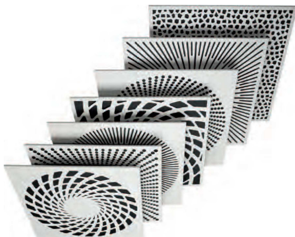
XARTO– Frontplatten lassen sich in vielfältigen Designvarianten gestalten