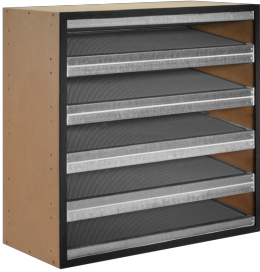
AKTIVKOHLE- FILTERZELLE, SERIE ACF