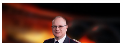
ANDRÉ EMME Rauchfreie Nutzungseinheiten