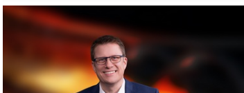
ARTIN MOSTERS Injektionsprüfung im Bauwerk!