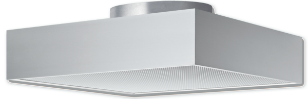
FHD – Ausführung ohne Mittelsteg