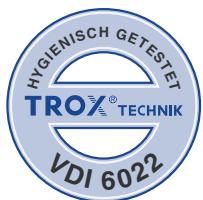
Geprüft nach VDI 6022