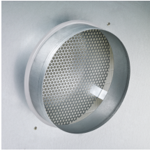
Stutzen mit feststehendem Prallblech