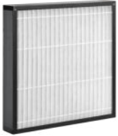
Z-Line-Filter, Ausführung PLA