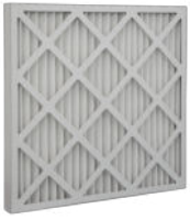
Z-Line-Filter, Ausführung CBC