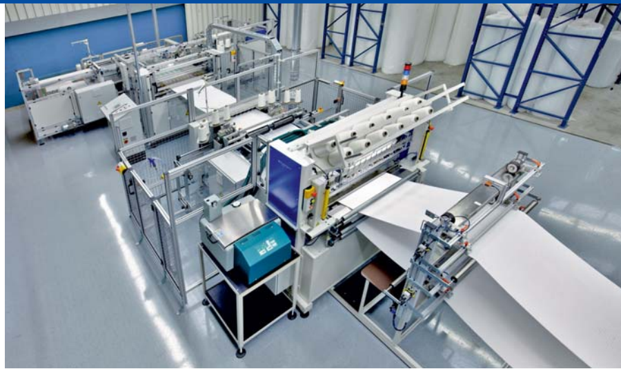
Modernste Fertigungstechnologie im TROX Werk Goch

TROX Taschenfilter mit NanoWave®-Medium erzielen im gesamten Betrieb einen sehr hohen Wirkungsgrad. Die Wirkungsgrade werden ohne Hilfe elektrostatischer Effekte erzielt und entsprechen in ausgezeichneter Weise der neuen EN 779:2011. Aufgrund ihrer hervorragenden Staubspeicherfähigkeit ermöglicht die NanoWave®-Technologie sehr lange Standzeiten, wodurch Wechselintervalle ohne Qualitätsverlust verlängert werden können.