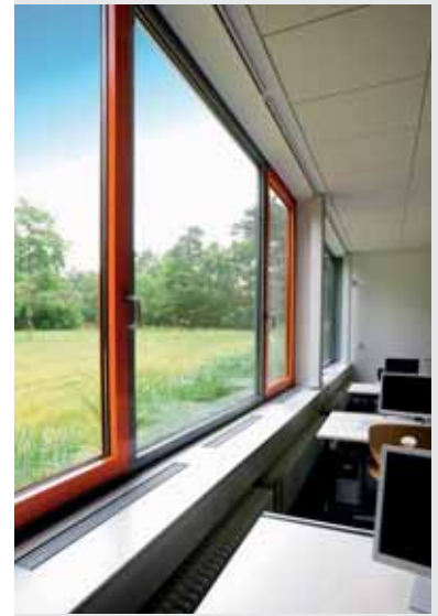
Berufliches Schulzentrum für Technik und Wirtschaft, BSZ Dresden

Eine Ansteuerung der Geräte kann auf Basis des CO 2 -Gehaltes der Raum- bzw. Abluft erfolgen, so dass kontinuierlich eine hohe Luftqualität gewährleistet ist. Alternativ kann man einfach und effizient mit festen Volumenströmen pro Betriebsart (Unterricht/Pause/Abwesenheit) arbeiten.